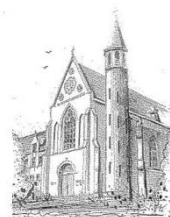
Parochie O.L.V. Onbevlekt Ontvangen Zenderen

We hopen op mooie vieringen met 30 mensen en voor wie er helaas geen plek is: alle vieringen kunt u volgen via kerkdienstgemist.nl , parochie Zenderen.